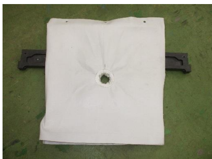
濾布 PP製、剥離性の良い濾布 従来の濾布と比べ開板時の作業が 少ない。