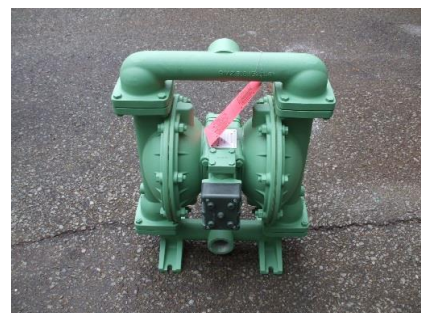
脱水ポンプ エアダイヤフラムポンプの為分解が 容易 接液部に摺動部が無いので、耐摩 耗性に優れている。 エア駆動で安全にご利用になれ ます。